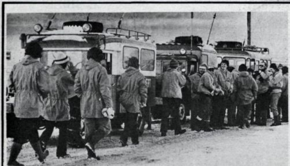
Leitarflokkar safnast saman til leitarinnar.