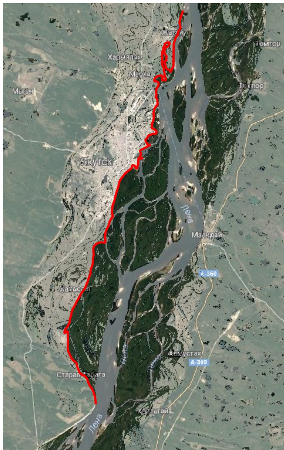
Рис.2. Схема уязвимых территорий при уровнях воды выше 780 см. в Промышленном округе г. Якутска, Республика Саха (Якутия) (В. Ефремова, 2018)