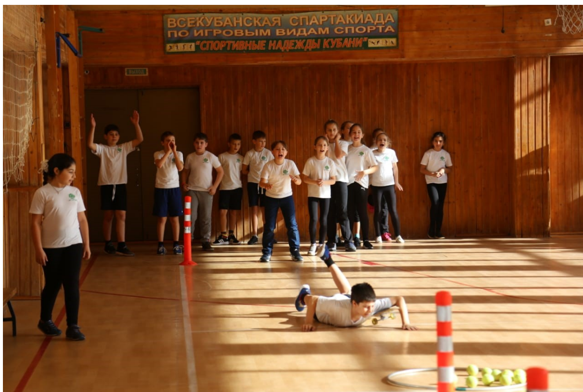
Фото 3. Кто первый? МОУ СОШ № 25 г. Сочи