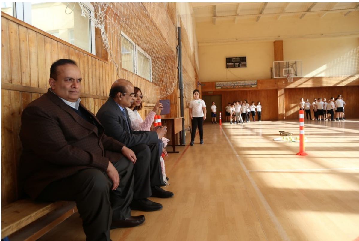
Фото 2. Министр образования Индии посетил урок физкультуры