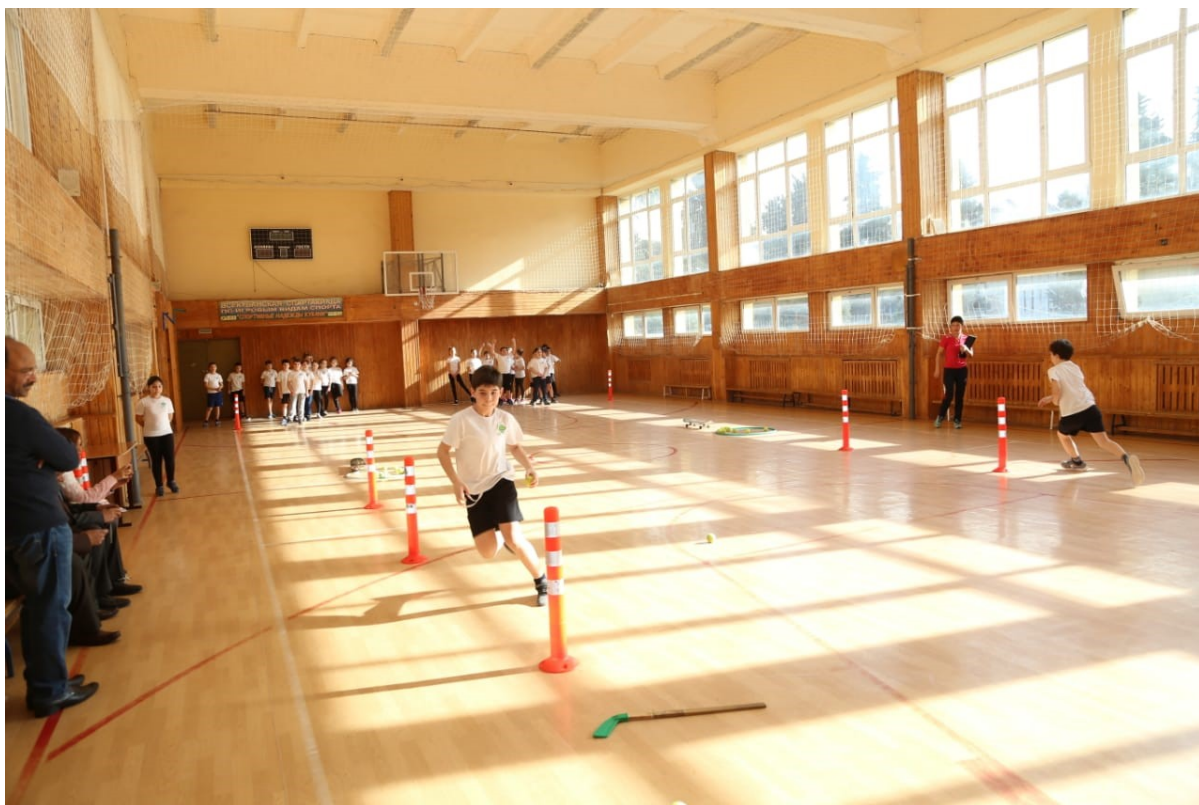
Фото 1. Эстафета на уроках физической культуры МОУ СОШ№ 25 г. Сочи