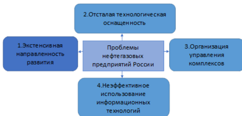
Рис.1. Основные проблемы нефтегазовых предприятий России

К первой группе можно отнести следующее: концентрирование углеводородных месторождений в местностях с тяжелыми климатическими условиями и нерациональная их разработка, значительная удаленность комплекса добычи и переработки, плохое развитие транспортной инфраструктуры.