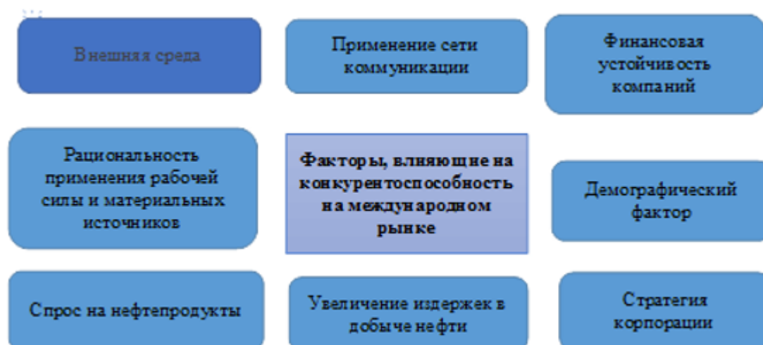
Рис.1. Факторы, влияющие на конкурентную способность России на международном рынке

Конкурентную способность нефтяных предприятий России на международном рынке достаточно трудно выявить и сложно измерить – способы и инструментарий управления, применяемые одним предприятием, могут вызвать нарушение стабильности в работе другого предприятия. На сегодняшний день конкурентная способность на международном рынке осуществляется путем влияния определенных факторов, представленных на рисунке 1.